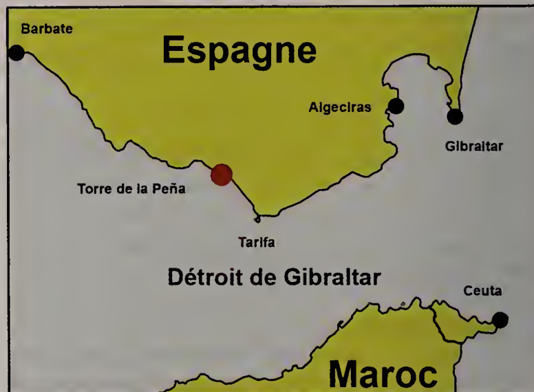
Fig. 1. Détroit de Gibraltar et environs.

guingois sur les aspérités du plateau rocheux, elles permettent à l'eau de circuler librement sous leur surface, laissant un espace libre entre elles et le sol, ce qui permet là le développement d'une faune riche en cnidaires, crustacés et mollusques. Sous l'une de ces pierres, se trouvait une anémone de mer ( Actinia equina ) à la base de laquelle se trouvait attaché un spécimen d' Opalia crenata (Fig. 2A).